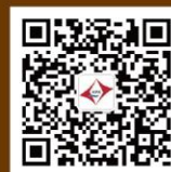
普华科技微信公众号

地址：上海市浦东新区向城路58号24层 电话：021-68406841 68406038 58207654 传真：021-68406611 网址：www.powerpms.com 邮箱：info@powerpms.com